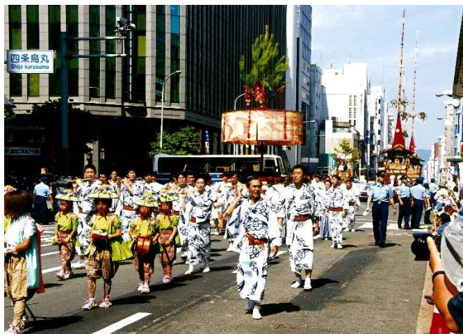
四条傘鉾 山鉾巡行の様子※2

本施設のある京都市下京区四条通西洞院西入ル傘鉾町から山鉾巡行する四条傘鉾は、応仁の乱以前にもその記録が見られ、古くから祇園祭に参加していた鉾です。この四条傘鉾は元治元年(1864)の大火によって衰退し、明治4年(1871)を最後に巡行の列から姿を消してしまいました。その後、昭和60年(1985)になって絵画資料を参考に傘本体が復元され、昭和63年に、棒振り踊りとお囃子が再興されて、百数十年の歳月を経て山鉾巡行の列に再び戻ってきた歴史ある鉾です。山鉾巡行時には、この再興した地元の子供たちによる棒振り踊りにより巡行を彩り、観光客を魅了しています。※1