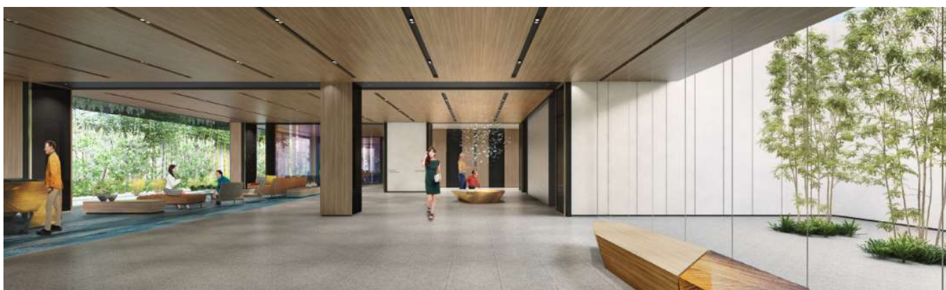
3階エレベーターホールから望むロビー（左手：庭園 右手：坪庭）