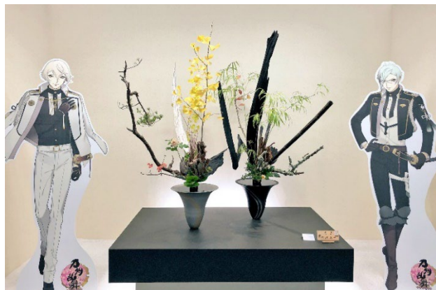
※画像参考：KNF2018 展示作品より