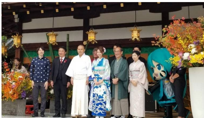
※画像参考：KNF2019 オープニングセレモニーより