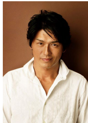
スペシャル応援ゲスト：高橋克典